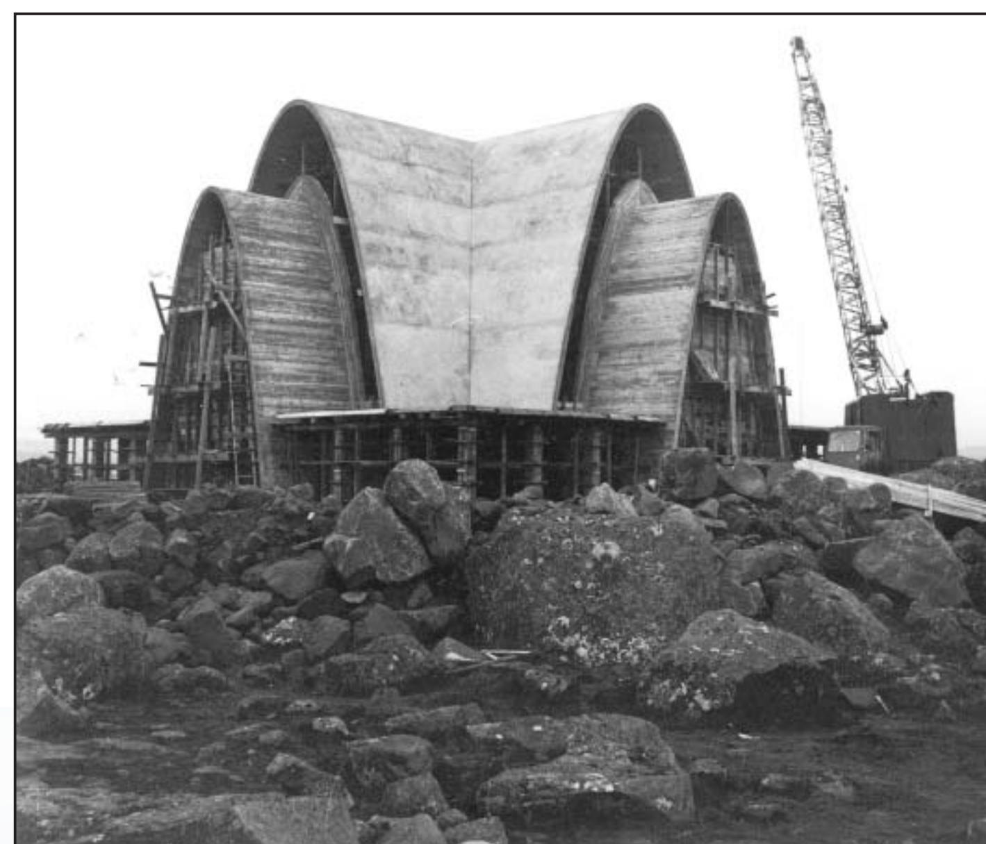
Bygging Kópavogskirkju, desember 1960.