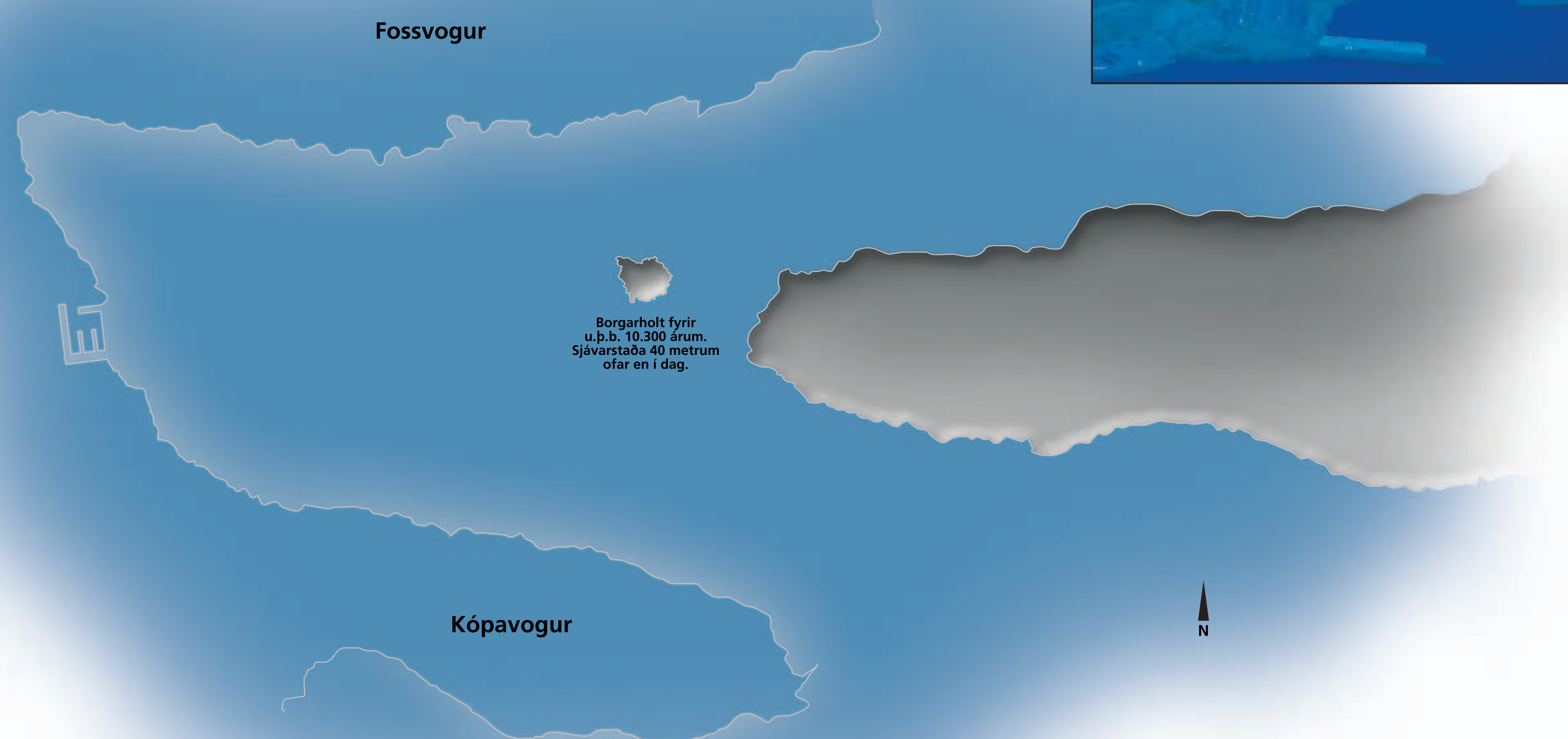
Borgarholt fyrir u.þ.b. 10.300 árum. Sjávarstaða 40 metrum ofar en í dag.