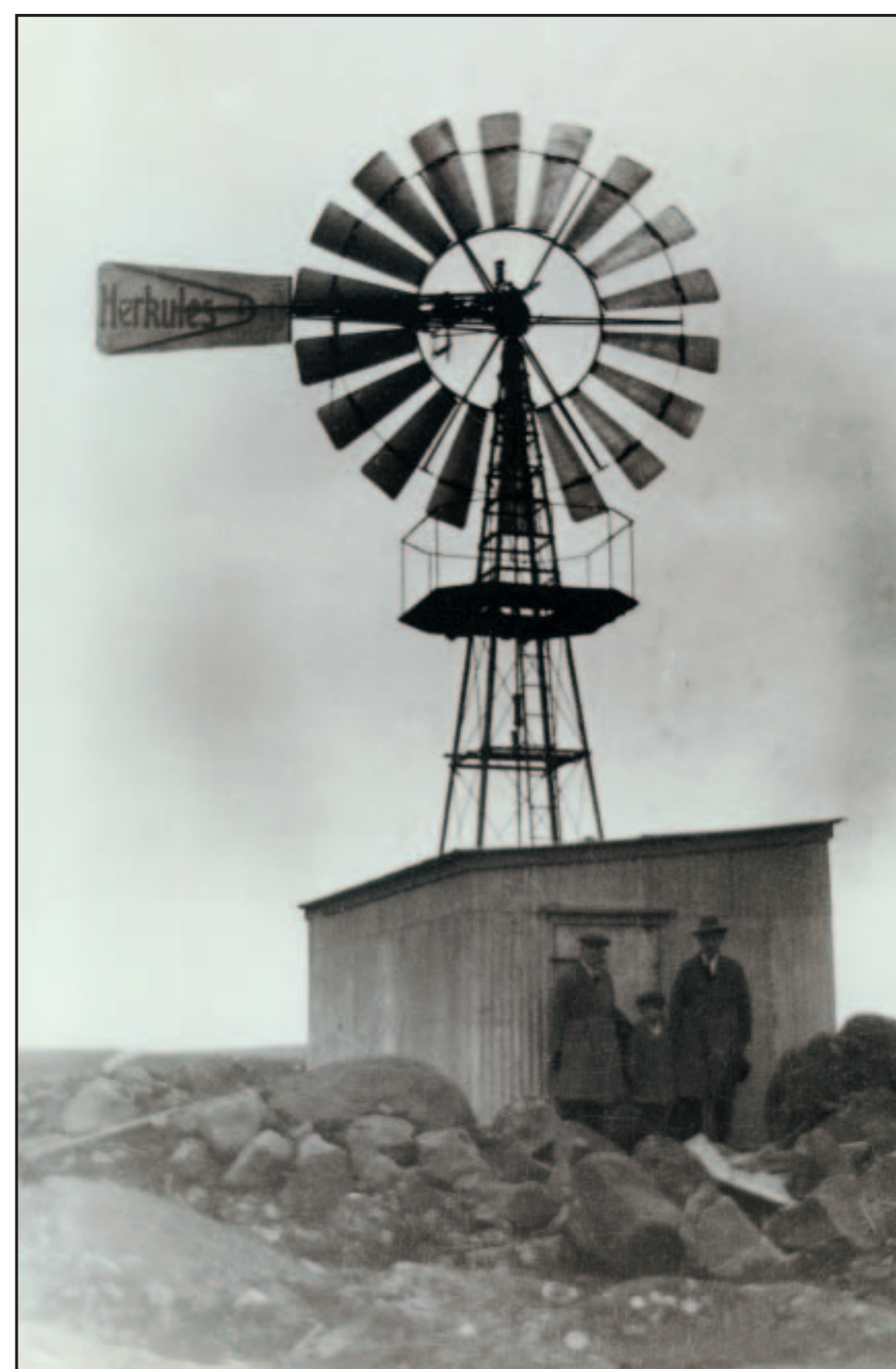
Vindrafstöð á Borgarholti fyrir 1930.

Borgarholtið var friðlýst sem náttúruvætti árið 1981.